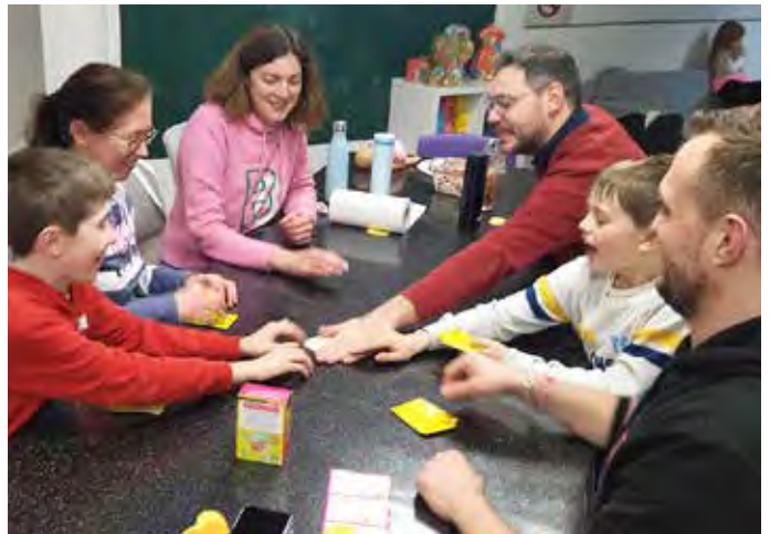
27 FÉVRIER : Franc succès pour la première soirée « Jeux libres » organisée à la Ludothèque. Après partage du repas, les 35 personnes préalablement inscrites ont pu jouer ensemble jusqu'à 22 heures.