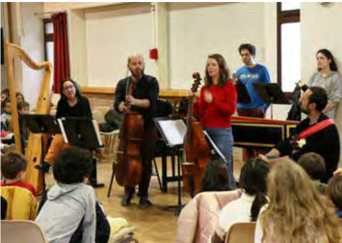
3 FÉVRIER : Concert de musique baroque donné gracieusement par l'ensemble « La Palatine » à l'Espace JKM, l'après-midi aux enfants de l'école élémentaire et le soir au grand public.