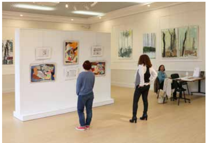
11 AU 19 MARS : Les oeuvres d'une trentaine d'artistes locaux, amateurs ou professionnels, étaient exposées en mairie à l'occasion du 22 e Salon des Artistes organisé par le service culturel de la ville.