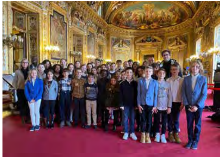
Le Conseil Municipal Jeunes (CMJ) et les adhérents de la structure jeunesse se sont rendu au Sénat, le samedi 11 février.

+Infos et inscriptions : Marc Eloffe, Tél. : 06 24 02 83 96