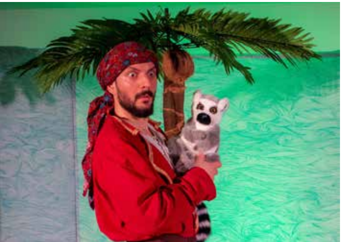
22 FÉVRIER : Pour les vacances d'hiver, le service culturel de la mairie proposait à son jeune public « Lilo, Pirate », un spectacle dépaystant et ponctué d'aventures extraordinaires.