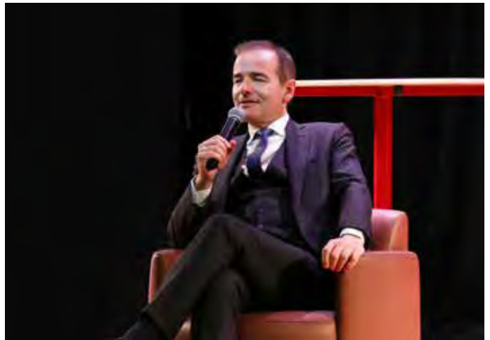
15 FÉVRIER : Franck Ferrand, célèbre écrivain féru d'histoire, présentait sur la scène de l'Espace JKM, une conférence sur le thème « La Beauté peut-elle nous aider à vivre ? » devant une salle comble.